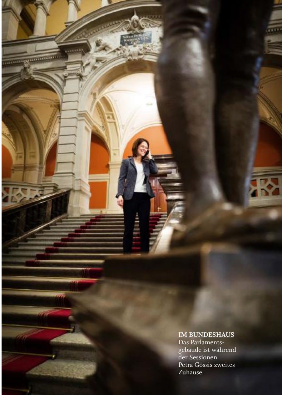
IM BUNDESHAUS Das Parlamentsgebäude ist während der Sessionen Petra Gössis zweites Zuhause.

Obwohl: Die Ausgangslage für Gössi ist eine ganz andere. Leuthards CVP lag nach den Wahlen 2003 am Boden. Sie hatte nicht nur - wie in allen Jahren zuvor - nochmals Wähleranteile eingebüsst, sondern auch einen ihrer zwei Bundesratssitze an Christoph Blocher und seine SVP verloren. Da hat es Gössi deutlich komfortabler. Ihr Freisinn ist nach jahrelangem Sinkflug vor rund drei Jahren wieder auf die Siegerstrasse eingebogen. Ein erstes Indiz für die Trendwende zeigte sich bei den bernischen Kantonswahlen im Herbst 2014: Die FDP gewann 0,3 Prozent. Nicht viel zwar und auf historisch tiefem Niveau. Aber immerhin. Im Frühjahr 2015 folgte die Bestätigung: in Baselland mit einem Plus von 3,9 Prozent, in Luzern mit 2,2 und in Zürich mit stolzen 4,4 Prozent.